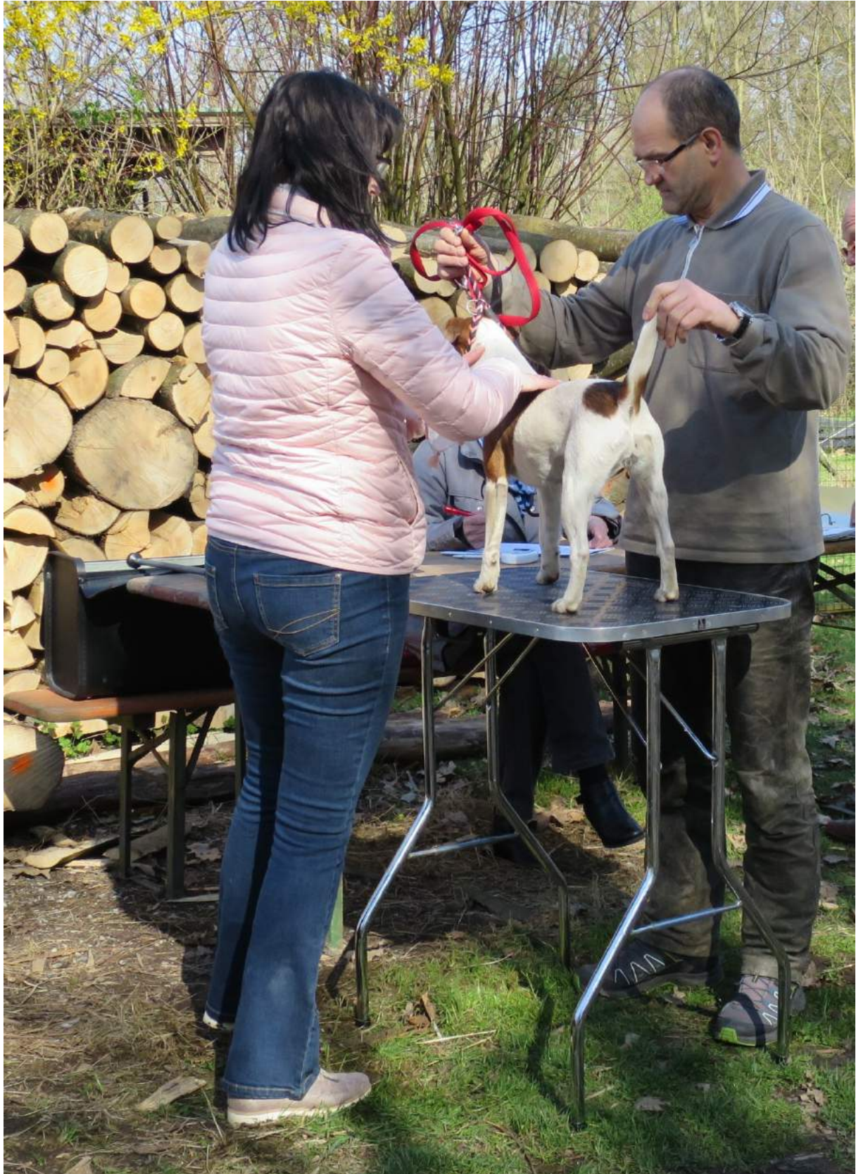
Start Nr. 5