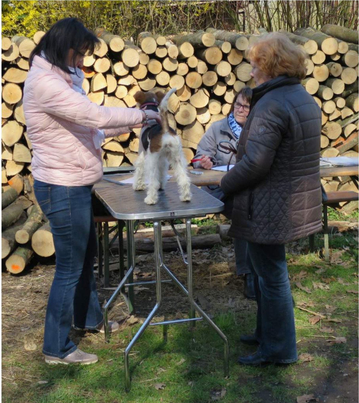
Start Nr. 3